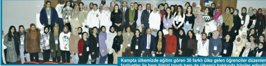
Kampta ülkemizde eğitim gören 36 farklı ülke gelen öğrenciler düzenlenen faaliyetler ile hem ilimizi tanıdı hem de ülkemiz hakkında bilgiler edindiler.

Samsun Gençlik ve Spor İl Müdürlüğü'nün organize ettiği 7. Tematik Kış Kampı Gönül Coğrafyası düzenlenen birbirinden güzel etkinlikler ile sona erdi